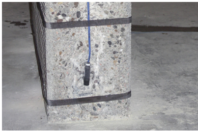
Montierte Titanbänder an einem Sützenfuss